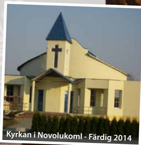
Kyrkan i Novolukoml - Färdig 2014

Det var glada resenärer som kom hem från denna första resa med många upplevelser i bagaget. Framförallt kontakten med människor men också tankar på hur vi skulle kunna hjälpa de människor som har det fattigt och svårt. Redan våren 2004 gjordes den första hjälpsändningen. Vi hade med oss kläder och skor och andra