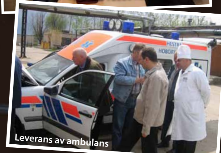
Leverans av ambulans