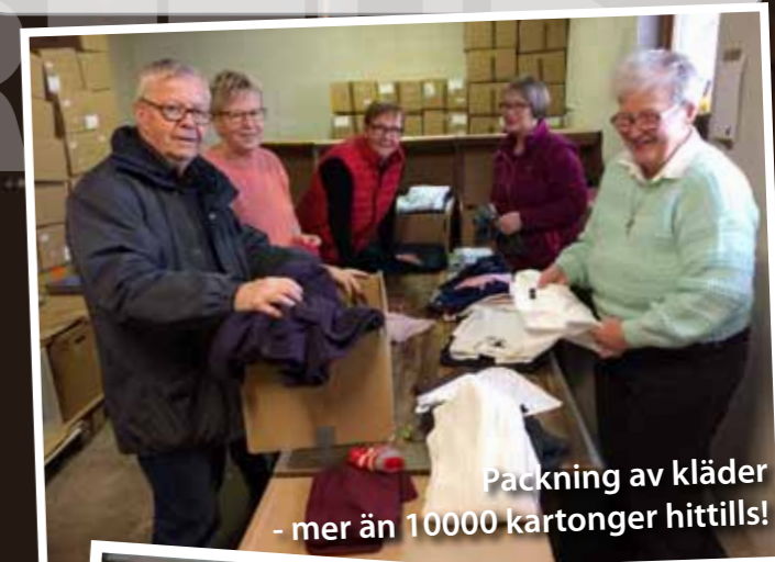
Packning av kläder - mer än 10000 kartonger hittills!

Tack för alla gåvor och förböner för detta arbete! Det finns en skrift framtagen till 15-årsjubileet att hämta i Missionskyrkan eller på Hestra Radio Sport. En mycket intressant läsning! Vill du fördjupa dej ytterligare - Följ med på en resa!